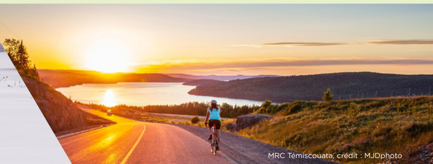
MRC Témiscouata