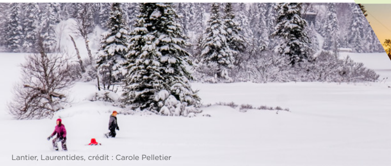
Lantier, Laurentides, crédit : Carole Pelletier